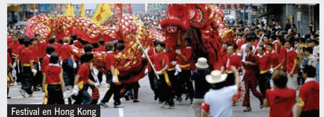
Festival en Hong Kong

Salida en vuelo de regreso a España, vía Helsinki. Llegada.